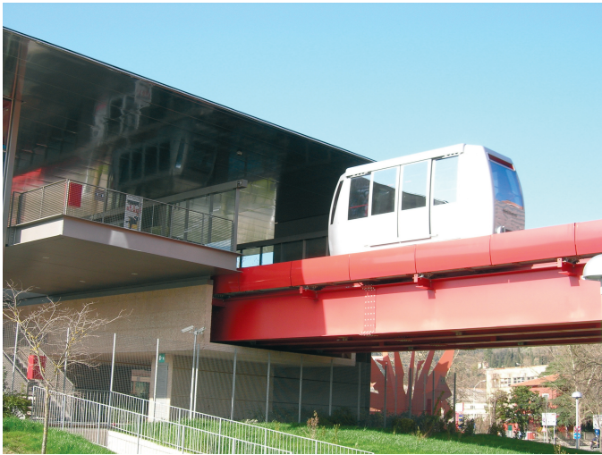
Figura 1: Il sistema Minimetrò

Il nuovo sistema di trasporto (Figura 1), primo al mondo nel suo genere, è infatti costituito da una linea a doppia sede di 3 km di lunghezza (dai confini del continuo urbano sino al Centro), su cui circolano, in modo completamente automatico, fino a 25 vetture della capacità di 50 passeggeri e passaggi ogni minuto circa 3 , che si prevede possa captare in media – a regime 4 – da 10.000 a 20.000 pax/giorno.